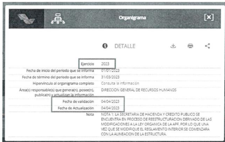
(Resolución de imagen de origen)

En el detalle de la información, se puede verificar la fecha de validación y actualización que coincide con el comprobante de procesamiento de información.